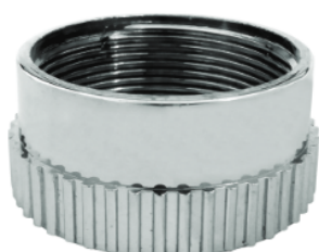
Cód. 8756 - Porca do Tubo de Ligação