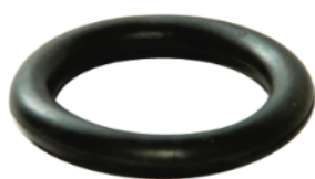
Cód. 245 - Arruela PVC Preto (Tubo de Ligação)