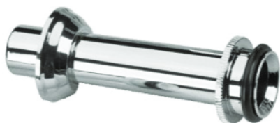
Cód. 1305 - Tubo de Ligação Cromado Ajustável