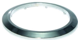
Cód. 2065 - Aro ABS Cromado para Acessório Banheiro