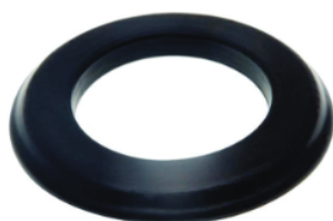
Cód. 201 - Arruela PVC Preta para Alça de Apoio